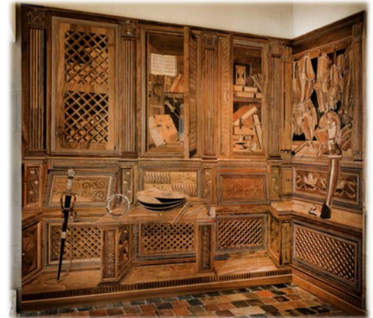
Détail d'un panneau