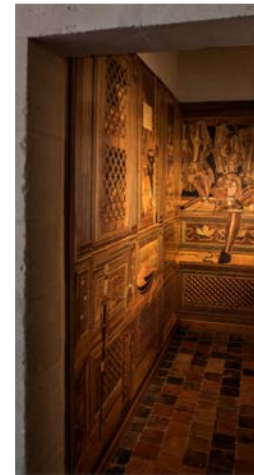
Entrée chez le client