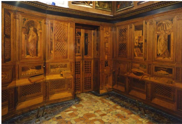
La commande du client Réaliser la copie du studiolo d'Urbino